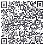
สิ่งที่ส่งมาด้วย